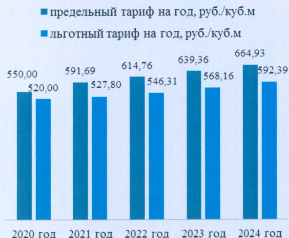
Рост тарифов в области обращения с ТКО