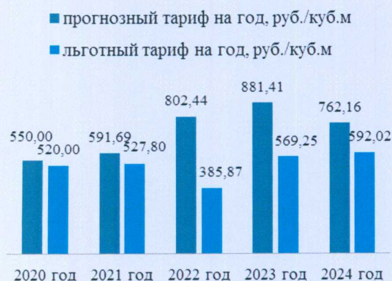
Рост тарифов (средних значений) в области обращения с ТКО